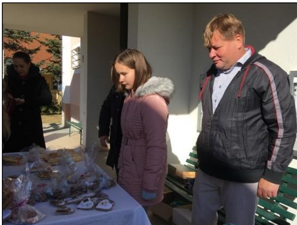
Foto z misijní neděle 24.10.2021